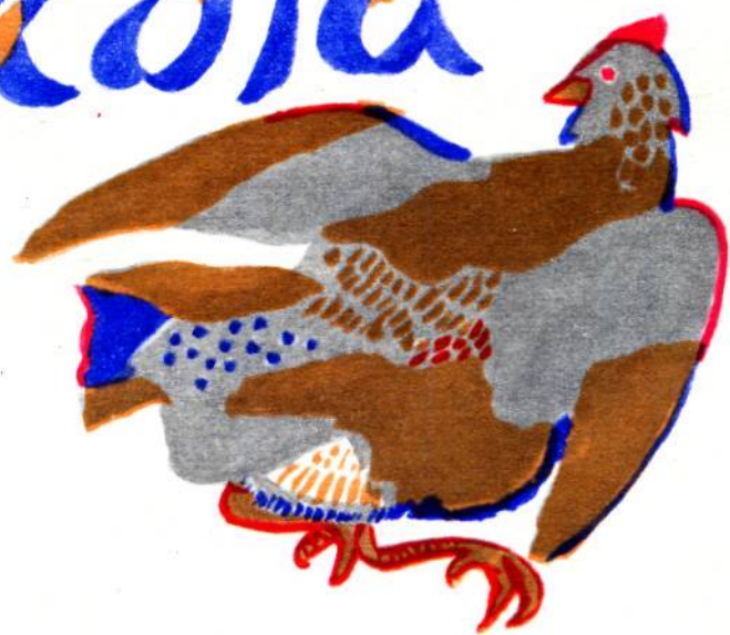
Рис. П. Митурича